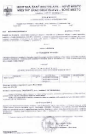
Zmena adresy.jpg 1578K